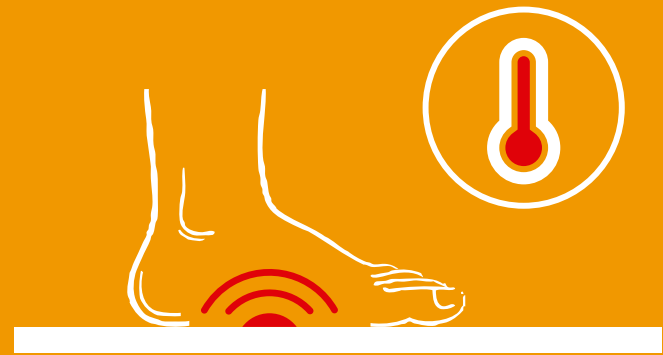
PORCELANATO WARM UP